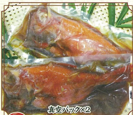
3 地物きんめだい姿煮