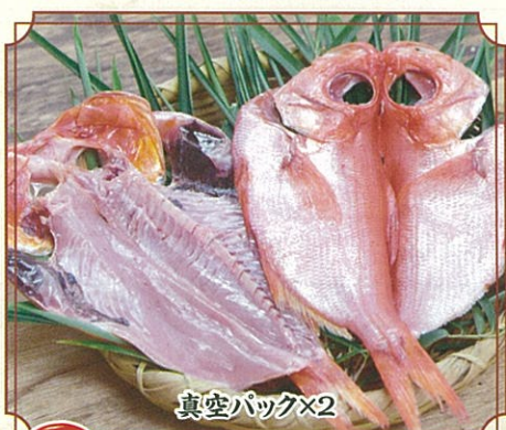
4 地物きんめだい干物[大]